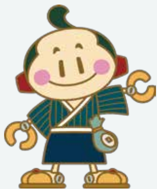
松阪商人サポート隊キャラクター 豪商あつきくん